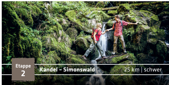
Etappe 2 Kandel – Simonswald 25 km | schwer

Fast 1.000 Höhenmeter: Eine Tagesbilanz, auf die Du stolz sein kannst. Aus der Altstadt von Waldkirch schlängelt sich der Weg vorbei an der im Wald versteckten Ruine Schwarzenburg und weiter hinauf zur Thomashütte. Wie ein Adlernest klebt die Hütte auf dem Felsen. Atemberaubende Tiefblicke ins Glottertal und ins Rheintal verschlagen Dir die Sprache. Jetzt ist es nicht mehr weit bis zur Gipfelpyramide des 1.241 Meter hohen Kandels.