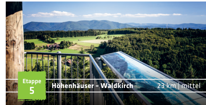
Etappe 5 Höhenhäuser – Waldkirch 23 km | mittel

Wie ein mächtiger U-Boot-Turm mit Aussichtskanzel ragt der Huberfelsen aus dem Wald. Vorbei an den über 300 Jahre alten Hirschlachschanzen führt der Pfad weiter zum Pfauenfelsen. Am Landwassereck fesselt Dich der Blick das lange Elztal hinunter. Sanfter gibt sich von nun an der Steig. Finsterkapf, Heidburg, Biereck – klingende Namen auf dem Weg zu den Höhenhäusern, wo sich Wanderer und Wirtsleute „Gute Nacht“ sagen.