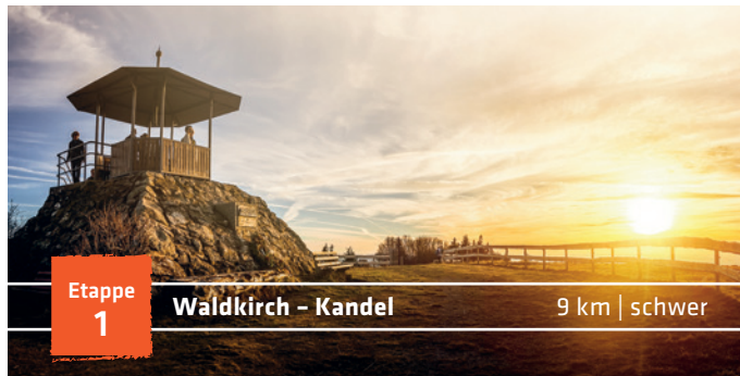
Etappe 1 Waldkirch – Kandel 9 km | schwer

...wie winzig klein ist doch die Welt da unten, wie fern schon der Alltag und wie intensiv das Wandern auf dem Steig. Dein Herz pocht nicht nur vom Aufstieg, sondern auch vor Begeisterung. In Deinen Beinen lässt die Anspannung nach. Du spürst den festen Fels unter Deinen Füßen. Du lebst. Hier möchtest Du länger verweilen. Den Schweiß auf der Oberlippe schmecken, das Prickeln der Sonnenstrahlen auf der Haut fühlen, den Duft der Bergwiesen und des feuchten Waldbodens riechen und bei den Fernblicken Staunen, Glück und Bewunderung erleben. Der Steig verändert Dich. Du findest Abstand und Ausgleich zum Alltag. Die gewaltige Schönheit der Natur und die Gastfreundschaft der Menschen öffnen Dich und Dein Herz. Komm!