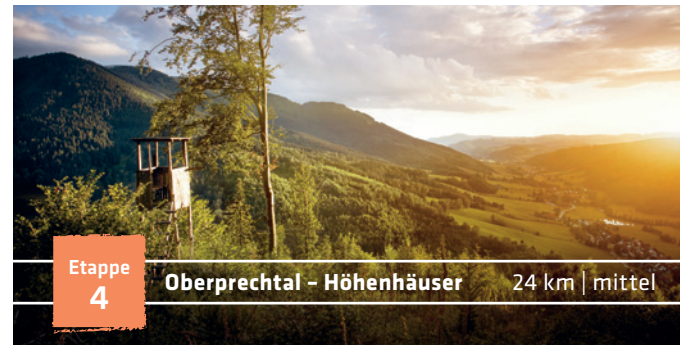
Etappe 4 Oberprechtal – Höhenhäuser 24 km | mittel

Dreh- und Angelpunkt im ZweitälerLand ist der Hörnleberg mit seiner Pilgerkapelle. Nach dem Aufstieg entlang des Stationenwegs erstreckt sich vor Dir das malerische Elztal. Erstaunlich schnell schaffst Du die nächsten Kilometer auf dem Hörnlepfad. Die Aussicht am Gschasifelsen nutzt Du als willkommene Atempause. An der Kapfhütte schweift Dein Blick noch einmal in die Ferne, bevor Du den steilen Abstieg nach Oberprechtal wagst.