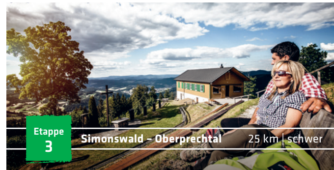
Etappe 3 Simonswald – Oberprechtal 25 km | schwer

Über die aussichtsreiche Kandelplatte gelangst Du ins tief eingeschnittene Simonswäldertal. Die Zweribach-Wasserfälle und die Teichschlucht schlagen Dich viel zu sehr in ihren Bann, als dass Du die Anstrengung spürst. Im Zick-Zack windet sich der Steig hinauf zur Hintereckhütte, bevor Du vorbei am Spitzen Stein auf steilen Pfaden vorsichtig wieder hinabsteigst. Zuletzt weist Dir die Wilde Gutach den Weg nach Simonswald.