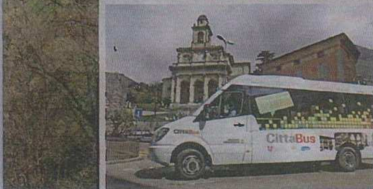
Un bus relie les villages au centre-ville.