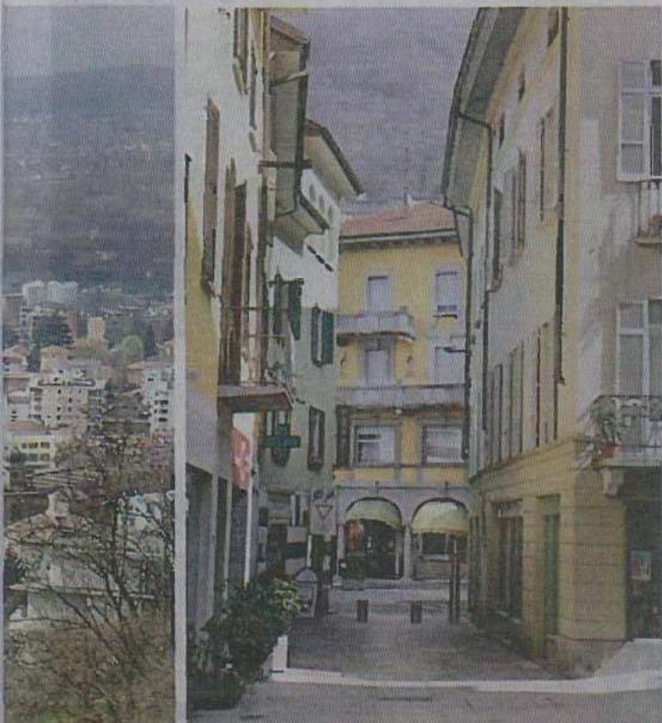
Les rues du centre sont piétonnes ou zone 30.