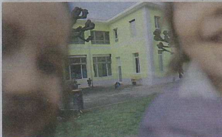
L'école du village est un bâtiment labellisé Minergie-P.

→ phase test. «La certification Cittaslow n'est pas éternelle. Périodiquement, il faut montrer au comité international de nouveaux projets.» Partout, le temps de parcours à pied pour les bâtiments les plus importants (gare, hôpital, centre historique) rappelle que tout trajet peut s'effectuer à pied.