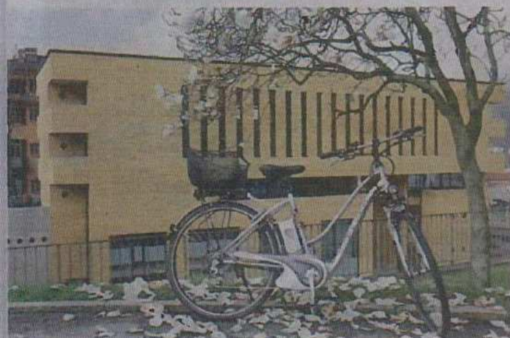
La commune subventionne l'achat de vélos électriques.